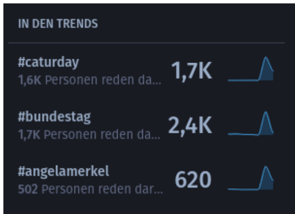
Bild 1: Screenshot der aktuellen Trends auf machteburch.social (als Beispiel. Diese Trends waren so nie wirklich vorhanden und dienen nur zur Veranschaulichung).

Hashtags gibt in fast allen sozialen Netzwerken